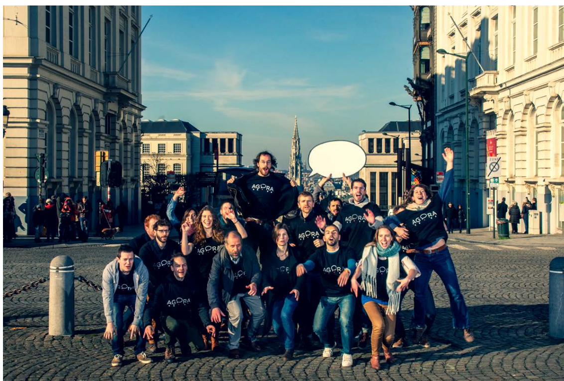
Bénévoles d'Agora en campagne électorale régionale

Ce chapitre nous replonge, le temps de quelques pages, dans cette incroyable aventure, racontée par quelques-unes des personnes qui l'ont vécue. Merci à elleux pour leurs partages.