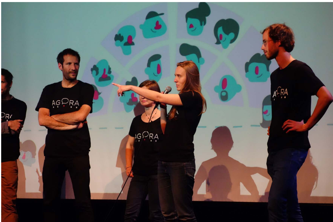
Lancement officiel du mouvement au Beurschouwburg - septembre 2018

« Le message est déjà : on se prépare aux élections pour avoir un·e élu·e dans l'hémicycle. »