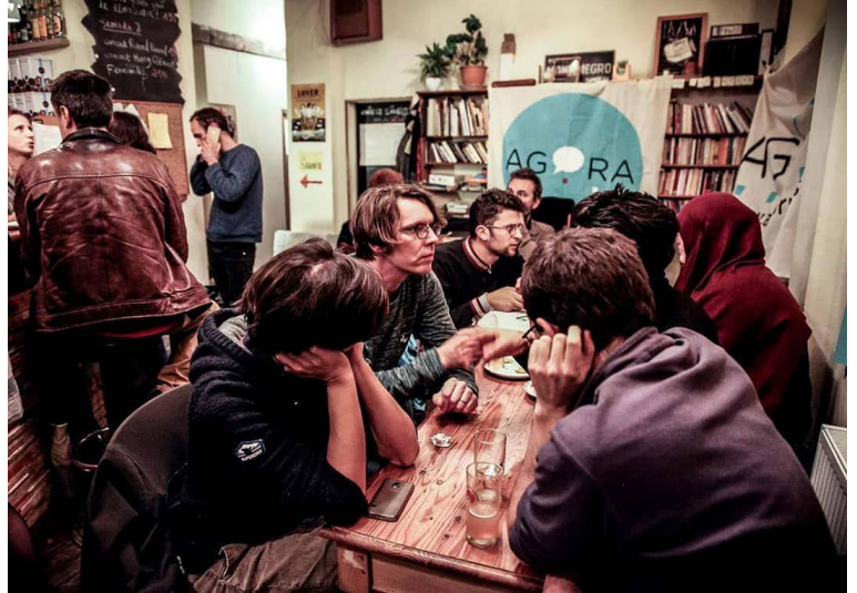
Agora Café - moments organisés pour découvrir les propositions d'Agora

En parallèle, les mêmes soirées sont organisées dans des cafés privatisés : les "Agora Cafés". L'enjeu de ces moments est à la fois de convaincre de l'intérêt démocratique des assemblées, mais aussi de transmettre des informations pratiques : par exemple, expliquer aux francophones comment iels peuvent voter dans la circonscription néerlandophone pour obtenir l'élu-e d'Agora.