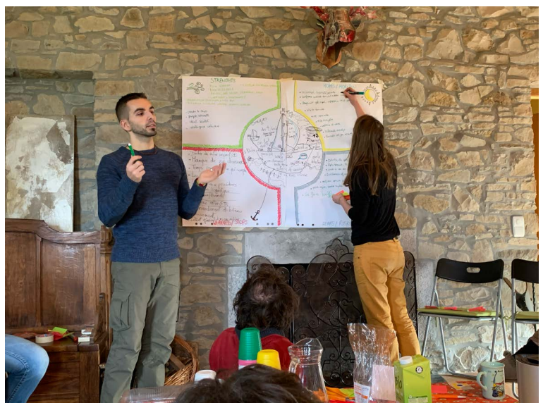
Une mise au vert du mouvement

Ce fonctionnement horizontal, inspiré de méthodes de sociocratie, n'a pas non plus fait l'objet de grandes discussions. C'est la proposition méthodologique des quatre compères qui voulaient une autonomie des groupes de travail. « Pour la plupart des gens, c'était une découverte. Ça symbolisait bien le côté vraiment "mouvement", où chacun·e a son mot à dire et où c'est clair où on peut le dire et comment. »