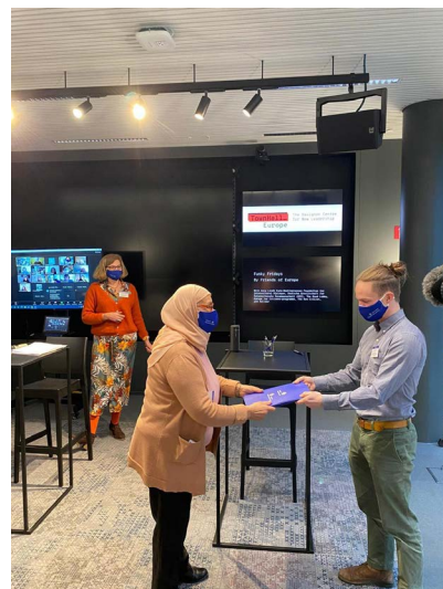
Une assembliste remet solennellement la résolution à l' élu d'Agora

La manière de rédiger chaque résolution est également, en soi, une communication. Le texte d'introduction de la résolution décrit le processus : chaque proposition est introduite par les intentions et valeurs délibérées qui sont à son origine et des annexes détaillent le processus pour les plus curieux·ses.