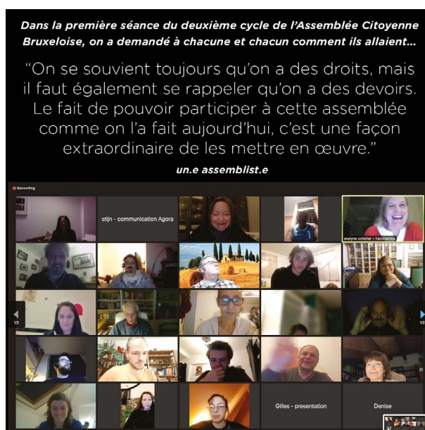
Post facebook/instagram racontant comment les participants vivent la 2 ème assemblée

Des capsules vidéos ont également été tournées pour présenter différents portraits d'assemblistes. Une vidéo donne aux assemblistes de la quatrième assemblée l'occasion de décrire le processus auquel ils et elles se sont prêt·e·s.