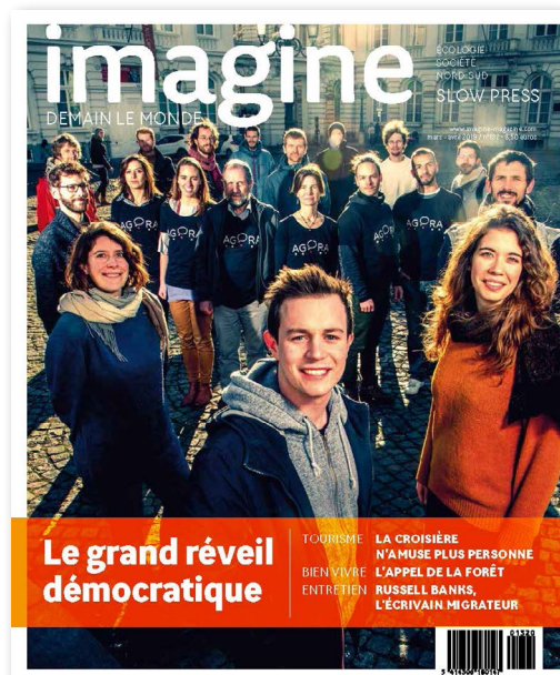
Numéro 132 du magazine "Imagine, demain le monde" mars-avril 2019

Les participant·e·s peuvent avoir leurs propres réseaux et canaux de communication. Comme pour les médias, l'organisation est responsable du respect du droit à l'image des participant·e·s. Il convient donc de leur expliciter, de la même manière et dès le début, qu'ils et elles sont tenu·e·s de respecter la confidentialité des autres personnes. De même, s'ils et elles peuvent communiquer sur leur ressenti par rapport au processus, il est impératif d'attendre la fin du processus pour communiquer sur les résultats.