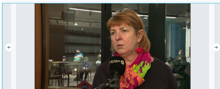
© RTBF/Chantal, Schaerboekoise tirée au sort, a tout de suite été volontaire pour faire partie de cette assemblée citoyenne.