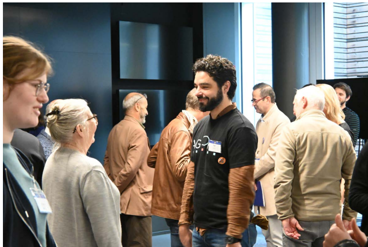
Animation brise-glace durant la 3 ème assemblée

Les moments d'accueil et d'introduction servent aussi à "créer et entretenir" le groupe. Des moments de "brise-glace" sont proposés de manière à apprendre à se connaître. Cela permet de créer un climat de confiance, de convivialité et de bienveillance qui perdurera durant les moments de travail. Cela peut aussi être des moments informels (comme proposer de se balader à deux dans un parc) ou des animations spécifiques (par exemple, demander à tout le monde de se placer dans l'espace en fonction d'où chacun-e habite sur le territoire). Le groupe continue par ailleurs à se consolider au fur et à mesure qu'il progresse dans la coconstruction, soutenu par des postures de facilitation adaptées. Dans l'expérience d'Agora, cela s'est ressenti notamment lors des tours de clôture de journée où la prise de parole s'est faite de plus en plus aisément, où les voix les plus timides se sont faites entendre chaque fois plus.