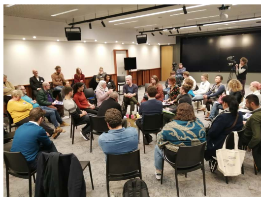
"Bocal à poissons" avec Alain Maron, ministre de l'énergie, de la transition climatique et de la démocratie participative