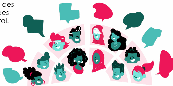
Illustration des assemblées d'Agora par Andres Hertsens

La délibération est à la fois une étape du processus - souvent vue comme requérant un certain temps - et une attitude : celle de prendre le temps de mesurer le pour et le contre, d'étudier tous les éléments qui entrent en compte et de mesurer les impacts possibles de la décision, pour trouver celle qui sera la plus adéquate. La délibération implique donc une responsabilité et un engagement de chacun·e vis-à-vis des autres personnes impliquées, mais aussi vis-à-vis du reste de la société.