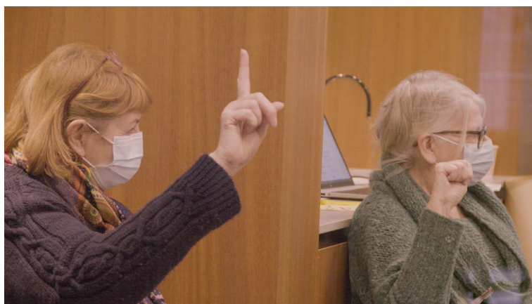
Demandes de parole durant une délibération

S'il y a des personnes qui ont quelque chose à proposer, tant mieux car le groupe en a besoin. On les laissera s'exprimer, en veillant à ce que celles et ceux qui veulent compléter ou critiquer puissent le faire (et donc parfois, en invitant à critiquer) et à ce que tout le monde reste impliqué, légitime et participe.